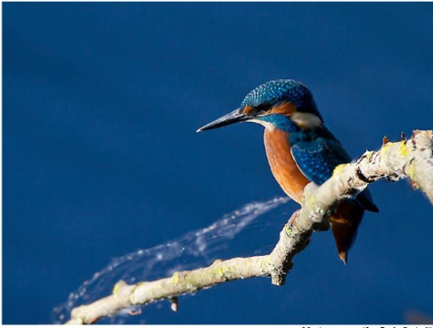
Martin pescatore

IDEE, STRUMENTI E OCCASIONI PER LA SCUOLA (Materna, Primaria, Secondaria di 1° e 2° grado)